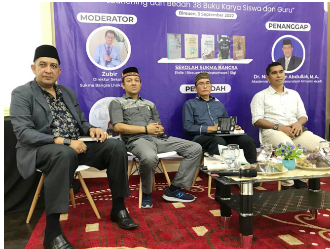
Sekolah Sukma Bangsa menggelar Kenduri Buku-2 di SSB Bireuen, Sabtu (3/9/2022), yang menghadirkan dua akademisi Universitas Malikussaleh sebagai pembicara.