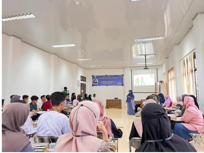
Psikologi Unimal Gelar Pelatihan Psychological First Aid.