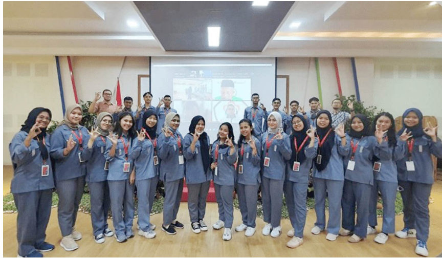
Mahasiswa dari sejumlah perguruan tinggi, termasuk dari Universitas Malikussaleh, diterima magang di PT Indonesia Asahan Aluminium (Inalum), Jumat (23/9/2022).