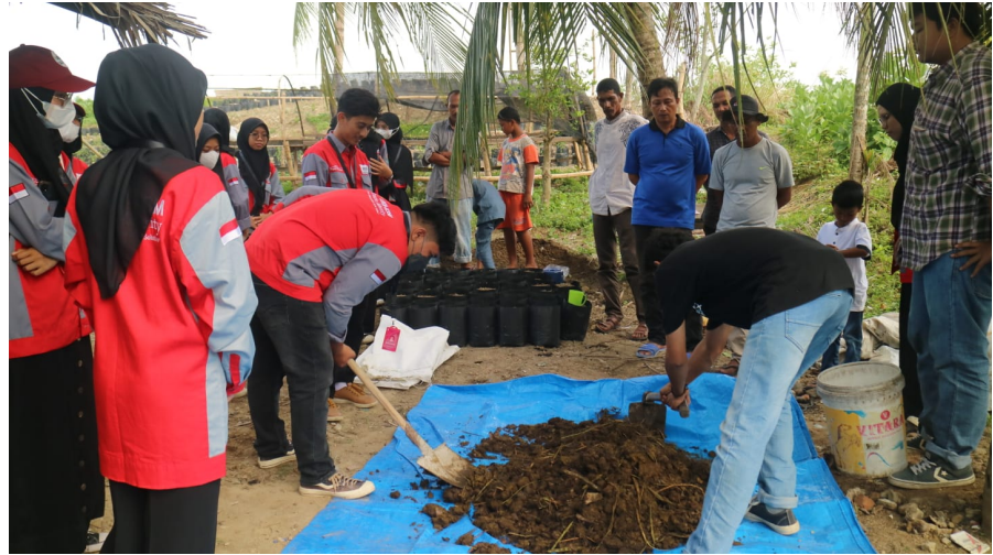
UKM-KSM Creative Minority Unimal Latih Petani Cara Buat Pupuk Kompos