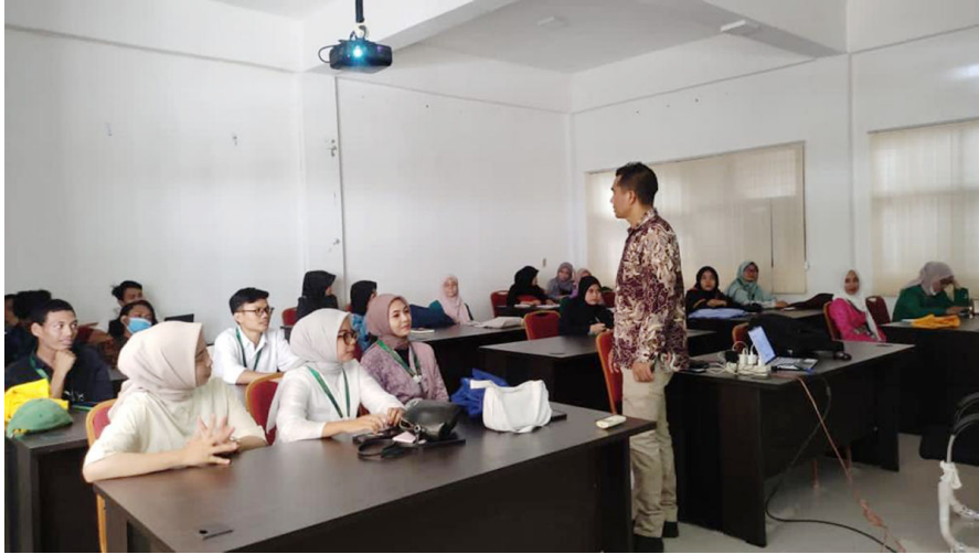
Mahasiswa PMM Modul Nusantara Kelompok 3 Universitas Malikussaleh mendengar penjelasan dosen pembimbing tentang tradisi khanduri blang dan khanduri laot di Aceh dalam pertemuan di Lhokseumawe, Sabtu (10/9/2022).