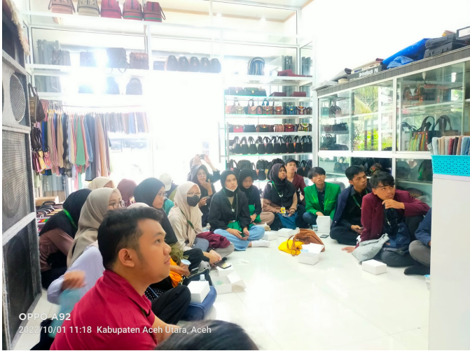
Mahasiswa PMM 2 Modul Nusantara Mengunjungi Konveksi Khas Aceh