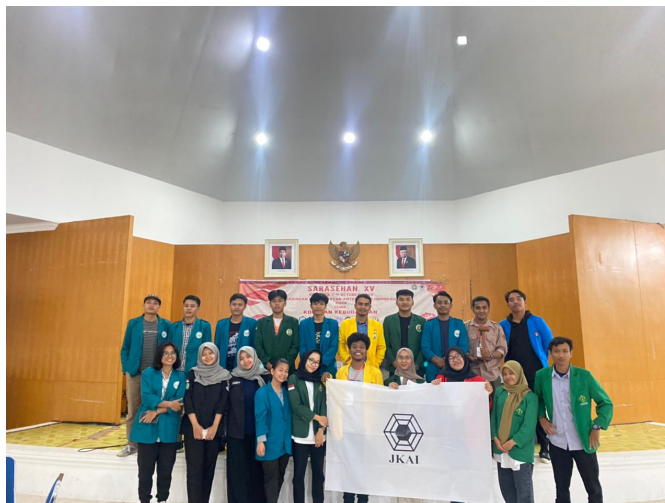
LingKA Unimal Hadiri Seminar Nasional dan Sarasehan yang Digelar di USU