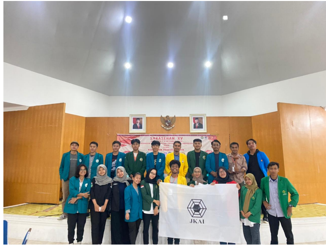
LingKA Unimal Hadiri Seminar Nasional dan Sarasehan yang Digelar di USU