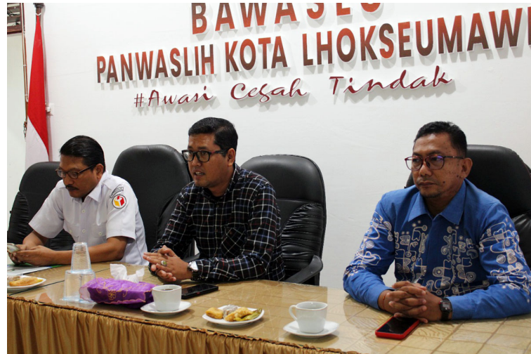
Program Studi Ilmu Politik Universitas Malikussaleh mengirimkan mahasiswa untuk magang pada Kantor Panwaslih Kota Lhokseumawe, Aceh, Rabu (12/10/2022).