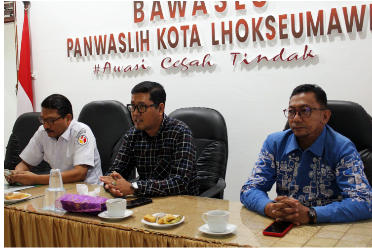
Program Studi Ilmu Politik Universitas Malikussaleh mengirimkan mahasiswa untuk magang pada Kantor Panwaslih Kota Lhokseumawe, Aceh, Rabu (12/10/2022).