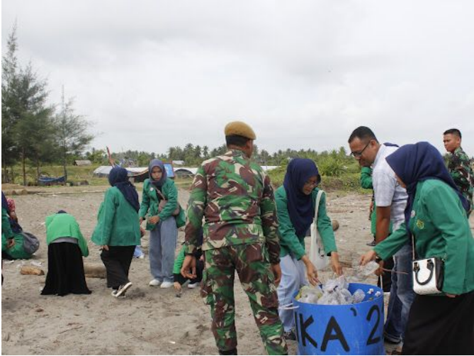
Himapfis Unimal Lakukan Aksi Bersih Pantai di Gampong Geulumpang Sulu Timu