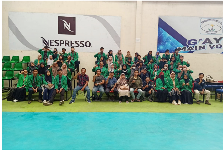
Sebanyak 200 mahasiswa Program Studi Agroekoteknologi Fakultas Pertanian melaksanakan praktikum lapangan di PT Olam Indonesia Aceh Coffee Arabika Unit di Bener Meriah, Aceh.