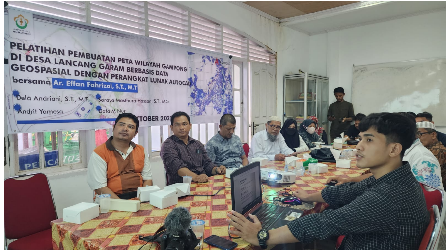
Dosen Teknik Unimal Bimbing Warga Membuat Peta Desa Berbasis Data Geospasial