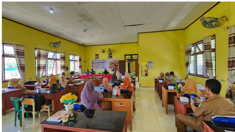
Dosen Unimal Gelar Pelatihan Pembuatan Buku Ajar Untuk Guru di SMAN 1 Pirak Timu