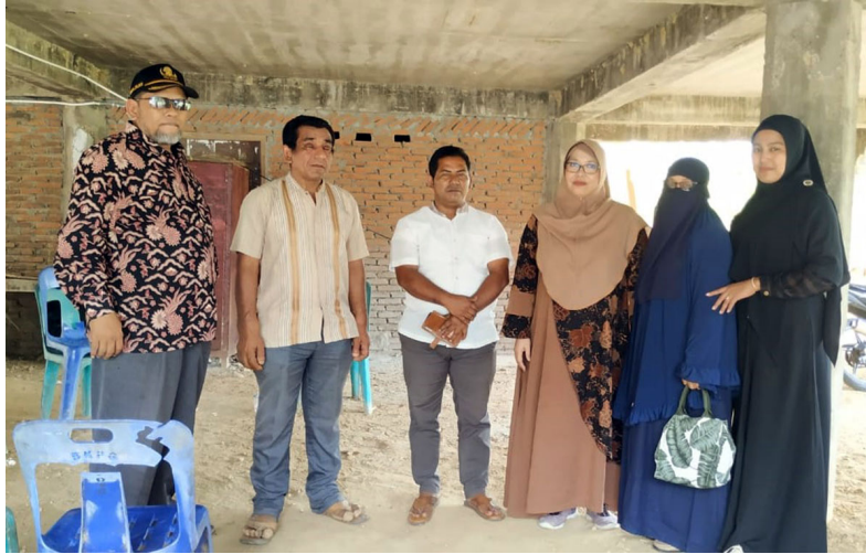
Sivitas akademika Fakultas Ekonomi dan Bisnis Universitas Malikussaleh menyerahkan bantuan bagi korban banjir di Gampong Cot Trieng Kecamatan Muara Satu Kota, Lhokseumawe, Selasa (18/10/2022).