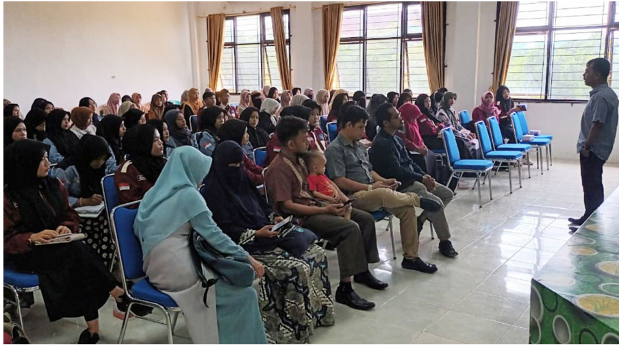
Sastrawan nasional asal Aceh, Azhari Aiyub, berbagi inspirasi menulis dan menerbitkan novel kepada mahasiswa Program Studi Pendidikan Bahasa Indonesia Fakultas Keguruan dan Ilmu Pendidikan Universitas Malikussaleh Kampus Reuleut, Aceh Utara, Jumat (21/10/2022).