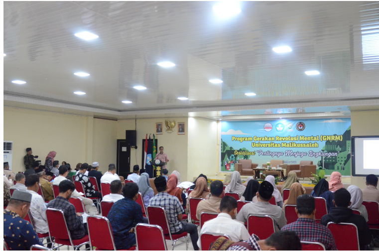
Unimal Sosialisasi Tentang Pengelolaan Sampah dan Menjaga Lingkungan.