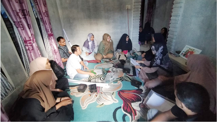
Dosen Akuntansi Unimal Lakukan Pemberdayaan UMKM Produksi Kue di Blang Pulo