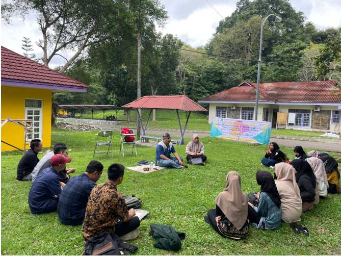
Himasos Unimal Adakan Diskusi tentang Karakter dan Etika dalam Perspektif Sosiologi