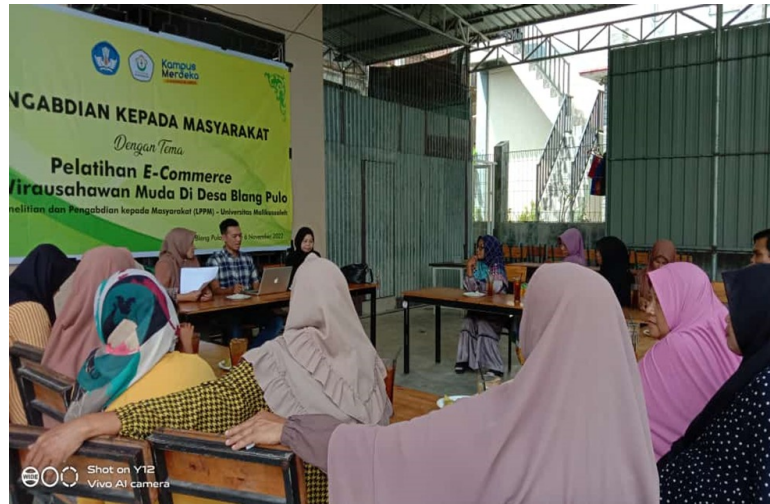
Dosen Unimal Berikan Pelatihan E-Commerce Bagi Wirausahawan di Blang Pulo