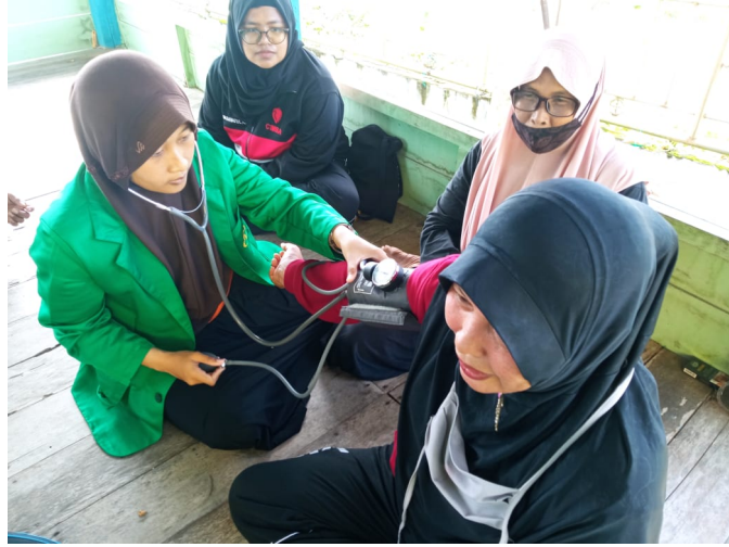
Mahasiswa KKN 05 Adakan Senam dan Tensi Darah Masyarakat di Gampong Bayu