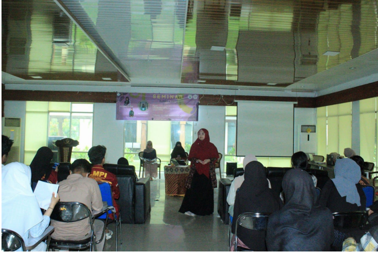
Psikologi Unimal adakan Seminar ILMPI X IGTC