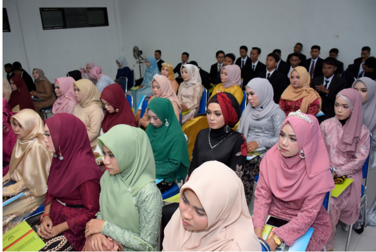
SARJANA Pertanian dan Perikanan dalam kegiatan Yudisium Fakultas Pertanian Unimal ke XXII yang digelar pada Rabu (30/7/2019).