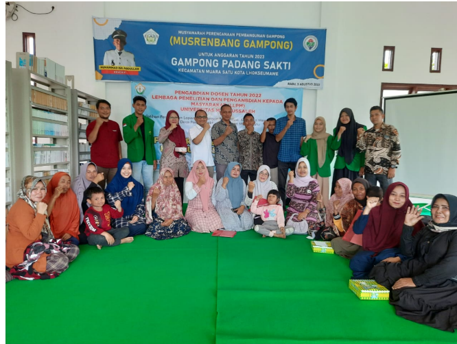
Dosen Unimal Beri Pendampingan Pelatihan Pengelolaan Keuangan bagi Usaha Mikro di Padang Sakti