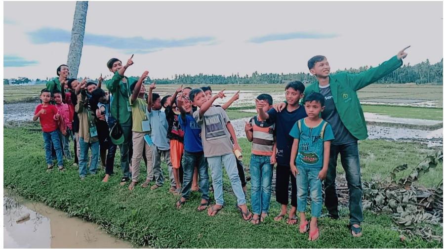
Ketika Anak-Anak Belajar Menyatu dengan Alam Bersama Mahasiswa KKN 110