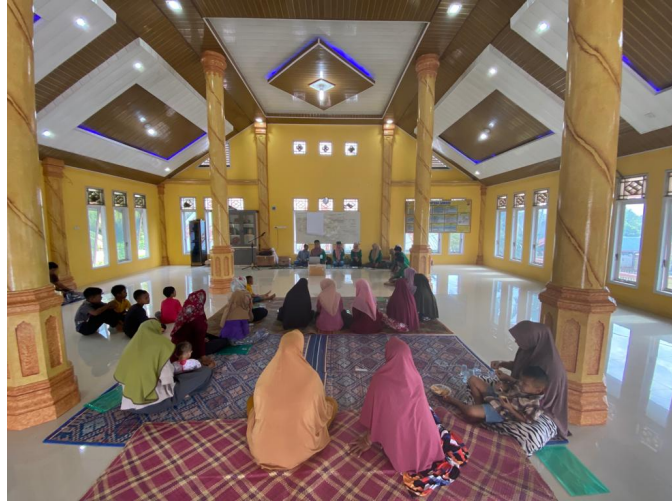
Mahasiswa KKN 98 Sosialisasi tentang Siaga Bencana di Gampong Sawang