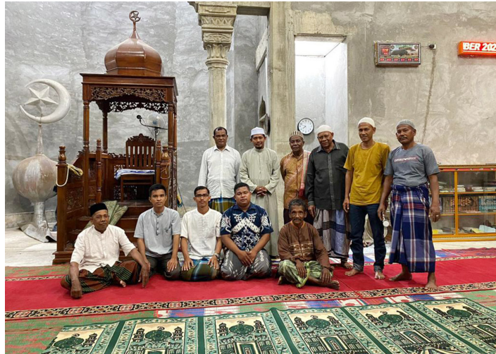
Mahasiswa Kuliah Kerja Nyata Pembelajaran Pemberdayaan Masyarakat (KKN-PPM) Universitas Malikussaleh Kelompok 58 mengikuti kegiatan pengajian kitab 8 di Masjid Gampong Alue Majron, Kecamatan Syamtalira Bayu, Aceh Utara.