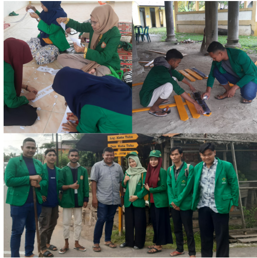
Selain Takziah Kerumah Duka, Kelompok KKN 66 Buat Plang Nama Jalan di Gampong Meunasah Beunot