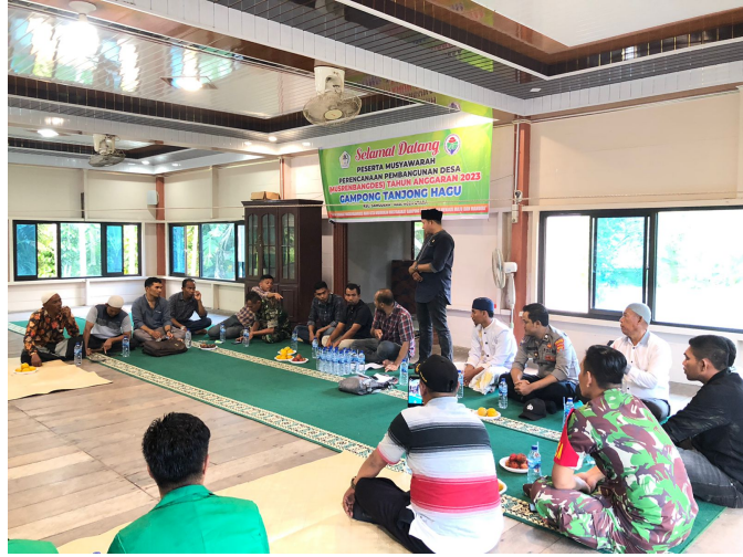
Kelompok 126 Ikut Berperan Dalam Musrebangdes Tanjong Hagu