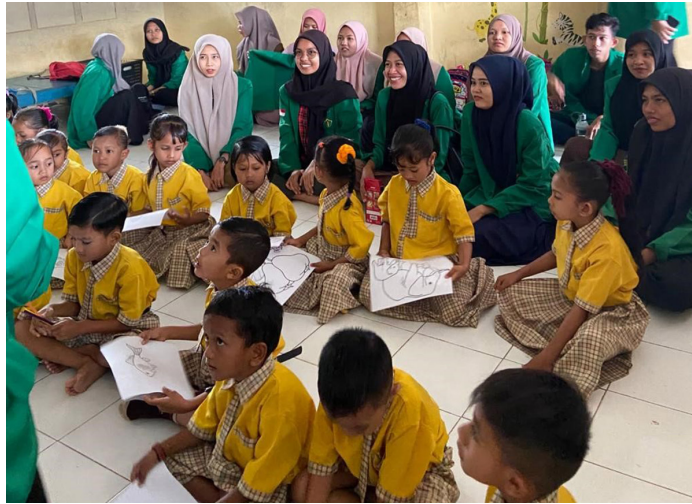
Mahasiswa KKN Kelompok 111 mengajar di Pendidikan Anak Usia Dini (PAUD) Putroe Bungsu Kuta Karang di Gampong Kuta Glumpang, Kecamatan Samudera, Aceh Utara.