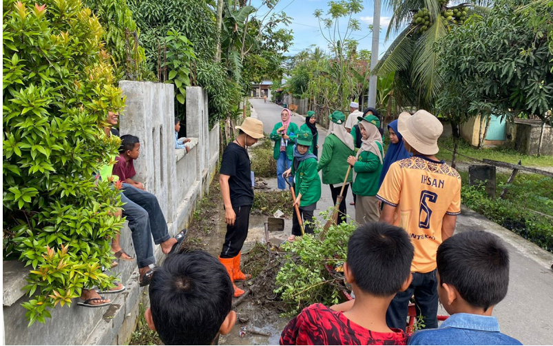
Mahasiswa KKN Kelompok 74 membersihkan saluran air di Gampong Dayah Tuha, Kecamatan Syamtalira Bayu, Aceh Utara, belum lama ini.