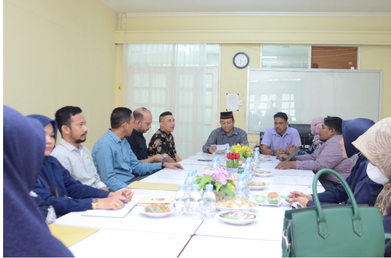
KIP Aceh Utara Silaturahmi dengan UPT BKP Universitas Malikussaleh.