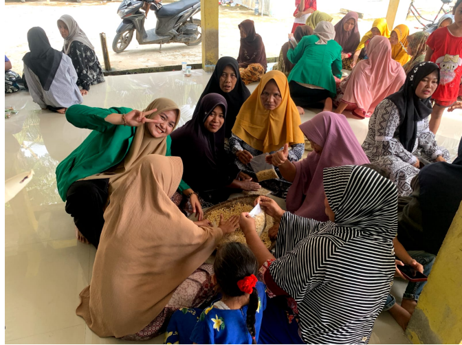
Melalui Program Pemberdayaan, Kelompok KKN 89 Latih Masyarakat Buat Tempe