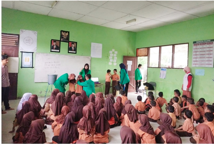
Masiswa KKN Kelompok 112 membangun perilaku hidup bersih dan sehat bagi murid SD Puuk Kecamatan Samudera, Aceh Utara.