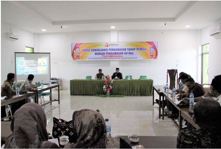
Dosen Unimal Jadi Narasumber Kegiatan Konsolidasi Pengawas Ad hoc di Pidie Jaya