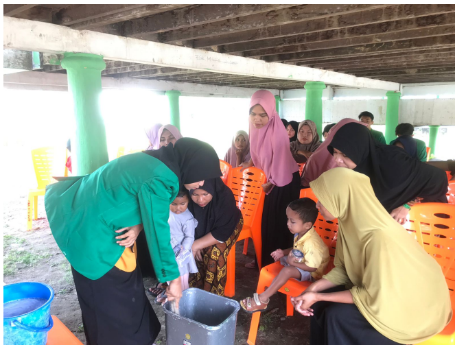
Mahasiswa KKN 116 Sosialisasi Proses Pembuatan Sabun Cuci Piring di Gampong Matang Ulim