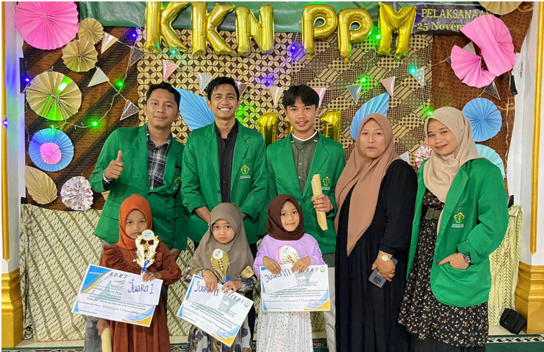
Mahasiswa KKN Kelompok 111 menggelar aneka lomba bidang keagamaan bagi anak-anak di Desa Kuta Glumpang Kecamatan Samudera, Aceh Utara.