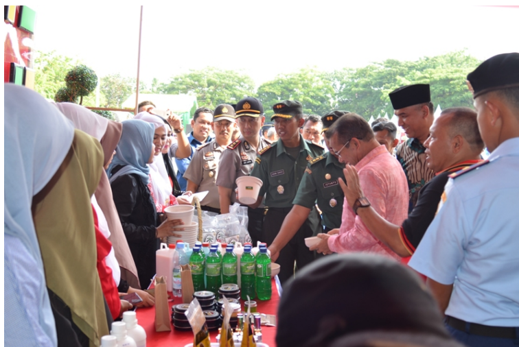
STAND Universitas Malikussaleh di pameran HUT RI ke-74 yang di gelar Kodim 0103 Aceh Utara.