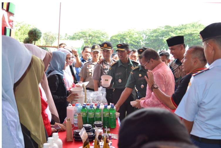
STAND Universitas Malikussaleh di pameran HUT RI ke-74 yang di gelar Kodim 0103 Aceh Utara.