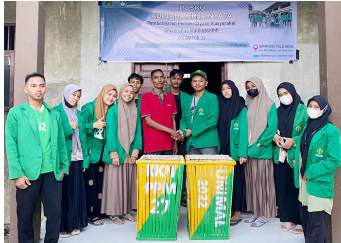
Mahasiswa KKN Kelompok 27 membuat tong sampah berbahan bambu di Desa Pulo Iboih Kecamatan Kuta Makmur, Aceh Utara.