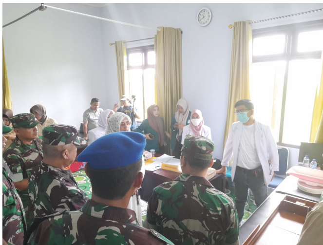
Bekerja Sama dengan Korem Lilawangsa, Dosen Kedokteran Unimal Lakukan Baksos