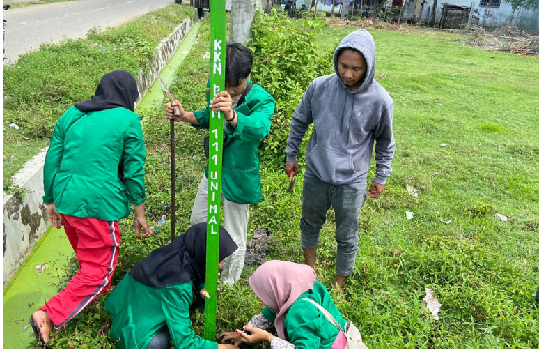
Mahasiswa KKN Kelompok 111 memasang papan nama wilayah di Gampong Kuta Glumpang Kecamatan Samudera, Aceh Utara, akhir November 2022 lalu.