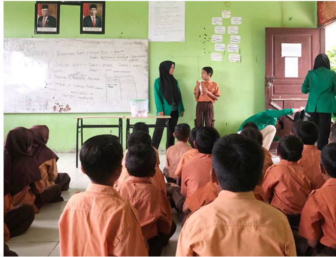
Mahasiswa KKN Kelompok 112 menunjukkan cara penurunan titik beku kepada murid SD di Puuk Kecamatan Samudera, Aceh Utara, akhir November 2022 lalu.