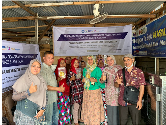
Tim Kosabangsa Unimal Adakan Pelatihan Pengolahan dan Pemasaran Ikan di Pusong Baru