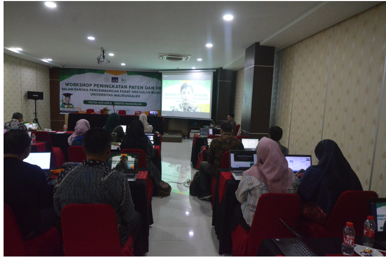
Kembangkan Pusat Unggulan Biodiesel, Unimal Adakan Workshop Peningkatan Paten dan HKI