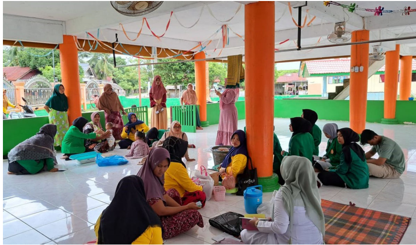
Mahasiswa Kelompok 112 melakukan sosialisasi narkoba bagi pemuda dan ikut membantu kegiatan di Posyandu Gampong Puuk Kecamatan Samudera, Aceh Utara, akhir November lalu.