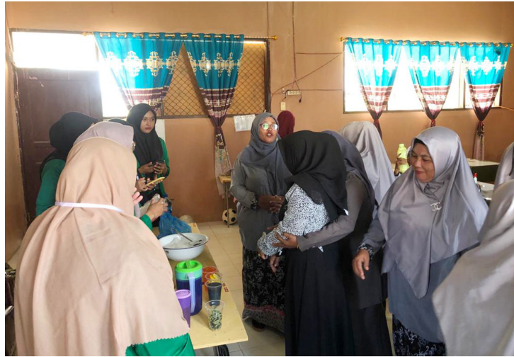
Mahasiswa KKN Universitas Malikussaleh Kelompok 112 memamerkan pembuatan teh telang dalam Expo 2022 di Gampong Puuk, Kecamatan Samudera, Aceh Utara, akhir November 2022.