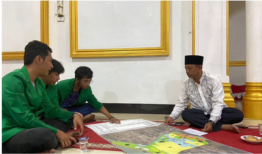
Mahasiswa KKN Kelompok 111 membuat peta Gampong Kuta Glumpang Kecamatan Samudera, Aceh Utara, Rabu (30/11/2022).