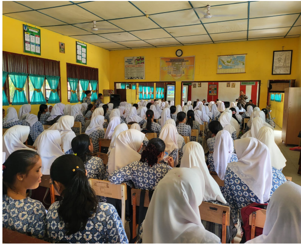
Rektor Universitas Malikussaleh ketika menjelaskan arti penting pendidikan di depan ratusan siswa SMA Negeri 1 Gunung Meriah, Aceh Singkil.