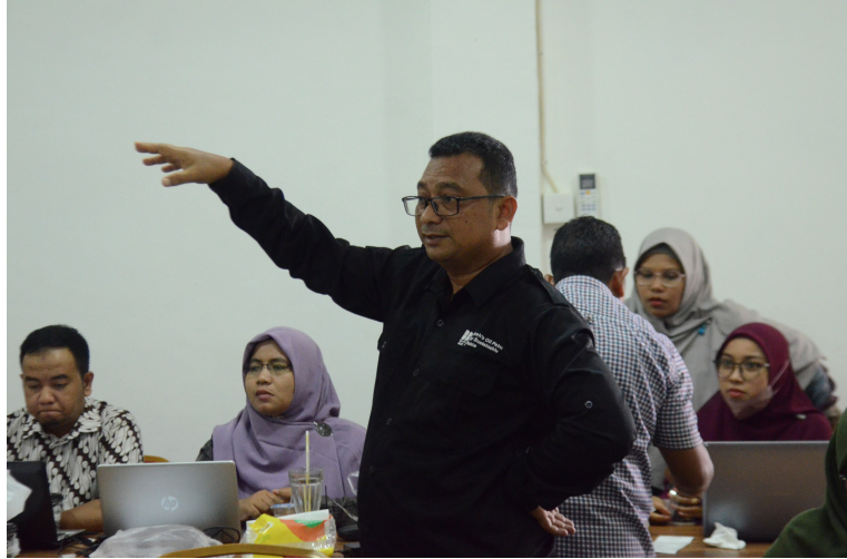
Fisipol Universitas Malikussaleh Adakan Penyusunan Borang Selama Empat Hari.