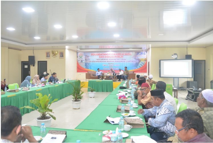
Fakultas Hukum Unimal Bangun Kerja Sama dengan JRS Indonesia