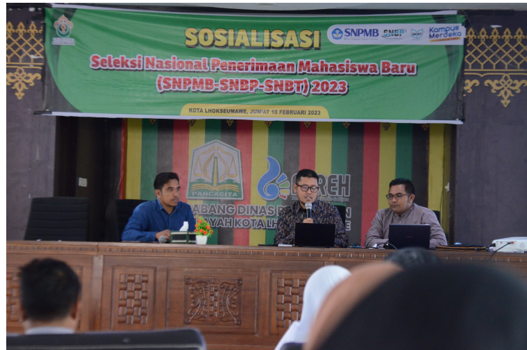
Unimal Sosialisasi SNPMB Kepada Seluruh Pimpinan Sekolah di Lhokseumawe.