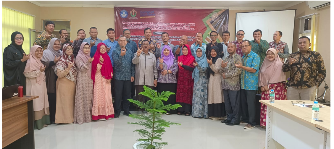
Fakultas Hukum Unimal Gelar Workshop Model Pembelajaran OBE dan RPS